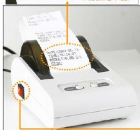
<AL-3100 및 프린터 연결>