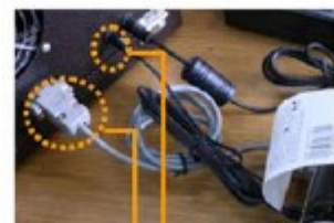
AL-3100 & 프린터 시리얼 포트 연결 모습