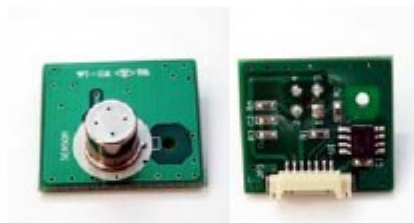
Sensor module (AL31M)

시리얼포트(AL-3100 & 프린터 연결 포트) 측정결과 프린터 출력 지원